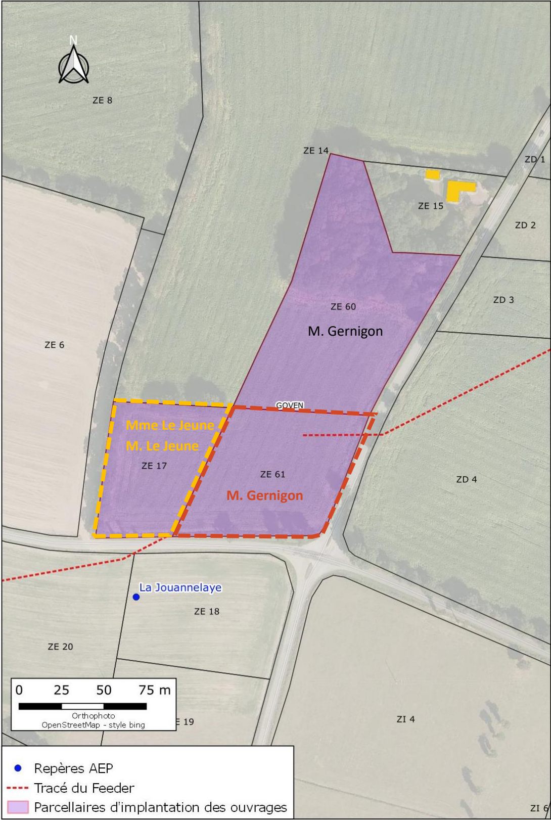
Figure 2 : Parcelles à acquérir sur la commune de Goven